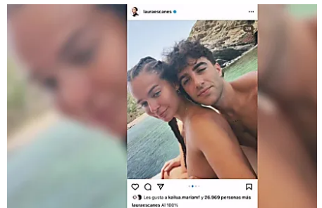
Laura Escanes y Álvaro de Luna protagonizan el posado del verano