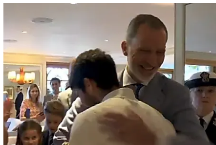
Las palabras del Rey Felipe VI a Alcaraz tras ganar Wimbledon: «No sé si eres consciente de lo que has hecho»