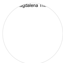
MAGDALENA TRILLO ARTÍCULOS