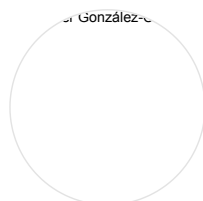
JAVIER GONZÁLEZ-COTTA ARTÍCULOS